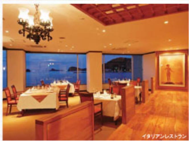
イタリアンレストラン

● 詳しくは、パンフレット「春・夏の旅No.42九州」の33ページをご覧ください。 ● 掲載商品の他、交通セットプランもございます。詳しくは販売店でお尋ねください。