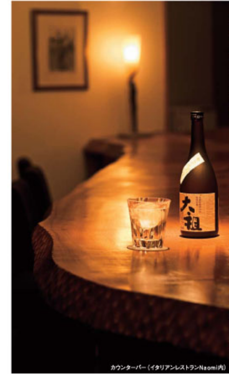
カウンターバー(イタリアンレストランNaomi内)