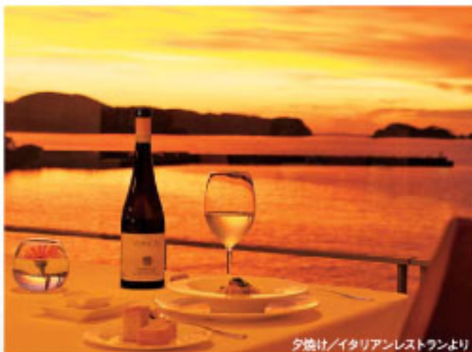
夕焼け/イタリアンレストランより

「お風呂ノ本温泉は知名度こそ高くありませんが、元寇の兵士が傷を癒したと訪れたという逸話が残るほど、深い歴史と優れた効能を合わせた温泉です。そのお湯を存分に味わっていたため、68度の源泉に一切加水はせず、30分ごとに湯守がお湯の温度を計測し、湯量を調節することで適温を保っています。温泉成分が濃く、含まれる鉄分や硫黄分が床が滑りやすくなったり、変色したりするので、もったいないようなことはありませんが、毎日すべてのお湯を落として掃除を行っています。」